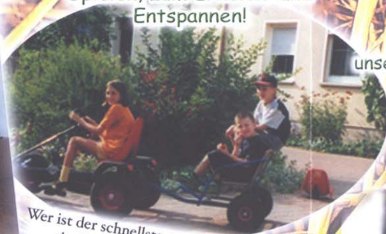
Wer ist der schnellste, unser "Riesenkettcar" der Trettraktor, oder das Bobbycar?

Ein Traum für alle Kinder, unser Hund Mike, unsere Kätzchen, Kühe, Kälber, Schweine, Hasen, Gänse und Enten alles zum Anfassen und Liebhaben!