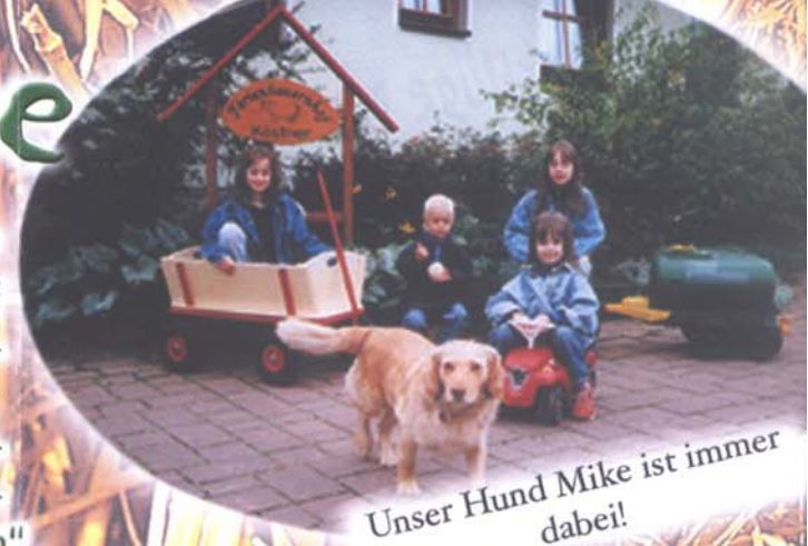
Unser Hund Mike ist immer dabei!

Wir heißen Sie "Herzlich Willkommen" auf unserem Bauernhof im Herzen des Steigerwaldes. Unser kleines, ruhiges Dorf Unterrimbach lädt Sie ein, Landleben richtig zu "erleben". Für groß und klein ist viel Platz zum Toben und Spielen, zum Erholen und Entspannen!